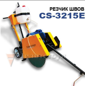
РЕЗЧИК ШВОВ CS-3215E