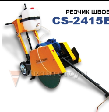
РЕЗЧИК ШВОВ CS-2415E