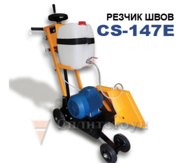
РЕЗЧИК ШВОВ CS-147E