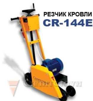
РЕЗЧИК КРОВЛИ CR-144E