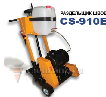
РАЗДЕЛЬЩИК ШВОВ CS-910E