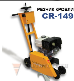
РЕЗЧИК КРОВЛИ CR-149