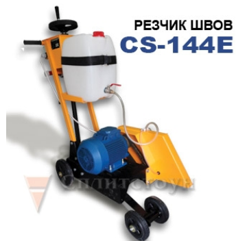
РЕЗЧИК ШВОВ CS-144E