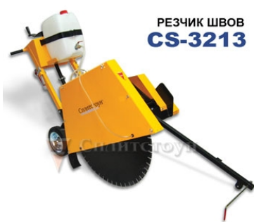
РЕЗЧИК ШВОВ CS-3213