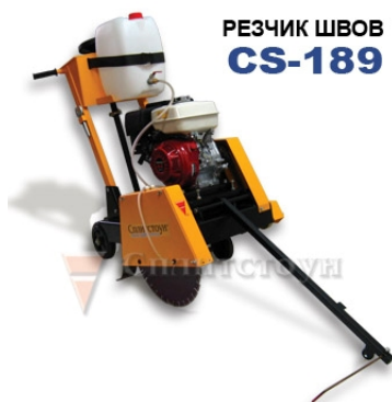
РЕЗЧИК ШВОВ CS-189

Двигатель Honda GX270 Диаметр круга, max 450 мм