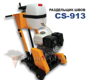
РАЗДЕЛЬЩИК ШВОВ CS-913