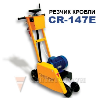
РЕЗЧИК КРОВЛИ CR-147E