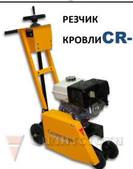
РЕЗЧИК КРОВЛИ CR-390