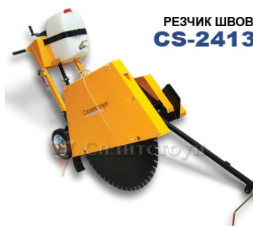
РЕЗЧИК ШВОВ CS-2413