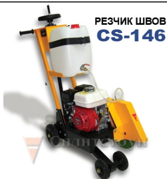
РЕЗЧИК ШВОВ CS-146