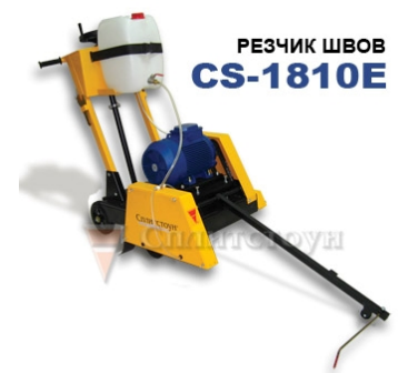
РЕЗЧИК ШВОВ CS-1810E