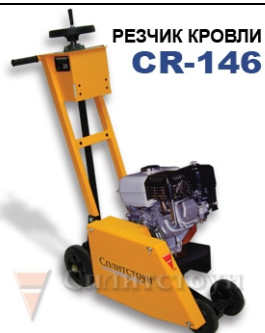
РЕЗЧИК КРОВЛИ CR-146